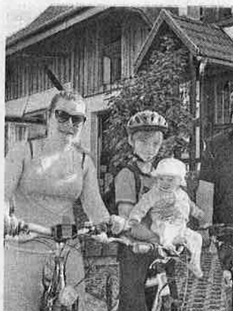
Même le bébé se réjouit !