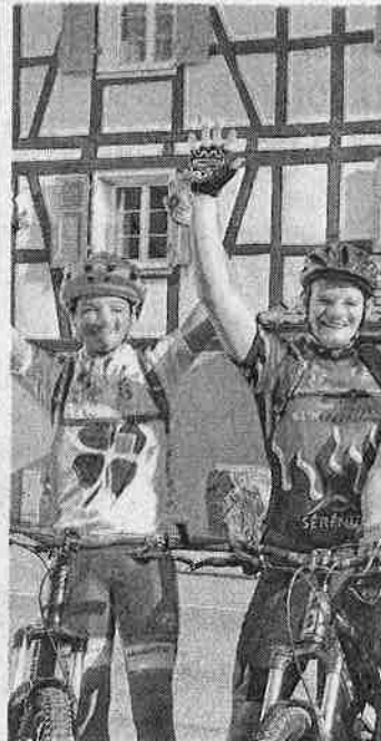
Shot, Izito, Foussil, Hopla Hil, S.P.M.

L e bonheur n'a pas filé dans les prés. Bien au contraire. Baigné de douceur, il a ensoleillé les chemins des collines du Sundgau. 210 cyclistes sur les deux parcours pour VTT. 44 autres sur celui conduisant par les routiers du côté de Ferrette et Wolschwiller.